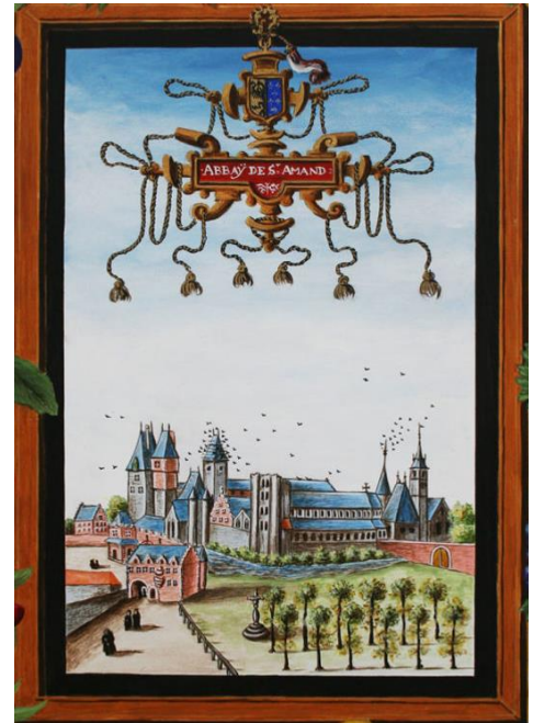
Miniature de Croÿ

Au bout de la rue Prevost (orthographiée sur la plaque Presvot !!), il y avait le café « chez Victoire », épouse de l'ancien ouvrier communal Michel Wibaut, situé juste à côté de l'ancienne baraque aux douanes et bien placé au débouché de l'antique chemin de Douai à Toumai.