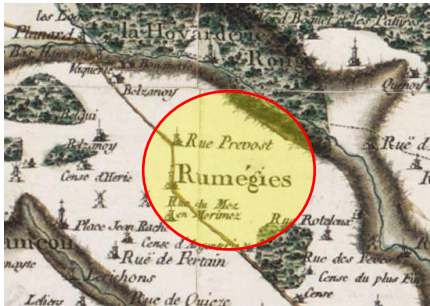
Carte de Cassini (1747)

Espace m é moire et patrimoine de Rumegies